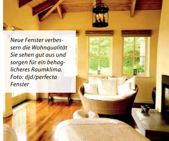
Neue Fenster verbessern die Wohnqualität. Sie sehen gut aus und sorgen für ein behaglicheres Raumklima.