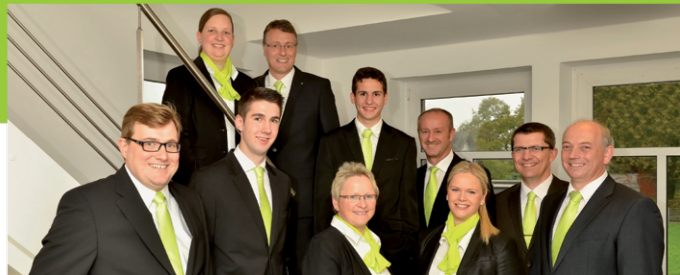
Das Team Nillies heute