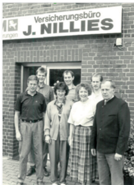
Das Team Nillies vor 25 Jahren

Heute – 50 Jahre später – betreut das Team der LVM-Versicherungsagentur Nillies an den 2 Standorten in Lippetal und Soest über 6.500 Privat- und Gewerbekunden, die in ganz Deutschland zu Hause sind. Das Team besteht aus 10 langjährigen Mitarbeitern, von denen viele über 20 Jahre in der Agentur beschäftigt sind. Sie kennen die Kunden