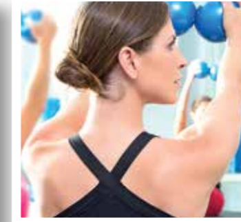
Lippetal Seite 12