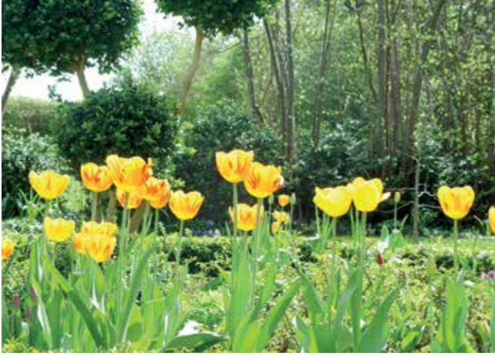
Frühling liegt in der Luft. Gartenbesitzer, die sich jetzt um Schnitt, Pflege und Pflanzung kümmern, können im Sommer ihr eigenes Grün in voller Pracht genießen.

Zu den ersten Gartenarbeiten des Jahres gehört der Frühjahrsschnitt von Bäumen und Sträuchern. Wichtig ist jedoch, Frühjahrsblüher wie Forsythien, Magnolien oder Obstbäume nicht jetzt, sondern erst nach der Blüte zu schneiden. Sommerblühern, wie Weigelie, Sommerlieder oder Hortensie, tut der Schnitt im Frühjahr hingegen gut, da er das Wachstum anregt. Hinzu kommt, dass bei den meisten Gehölzen Jung-