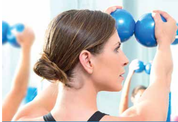
Regelmäßige Bewegung kann langfristig vor Rückenschmerzen schützen und bestehende Probleme lindern.

Einer repräsentativen Umfrage der IKK classic zufolge gibt jeder Zweite einseitige Belastung und eine falsche Körperhaltung und eine falsche Körperhaltung als Hauptursachen für seine Rückenbeschwerden an. Auf Platz zwei rangiert Bewegungsmangel (22 Prozent), gefolgt von zu viel Stress im Beruf (zwölf Prozent). Rund 67 Prozent der