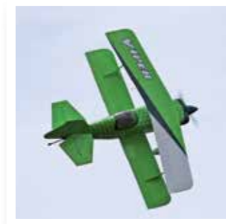
Bad Sassendorf Seite 5