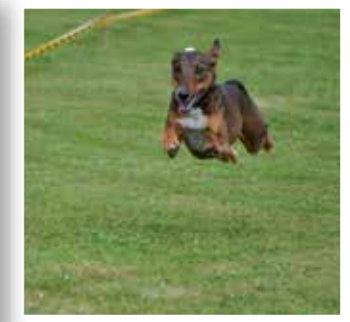
Herzfeld Seite 15

Modellflugmesse auf dem Flugplatz im Lohner Klei